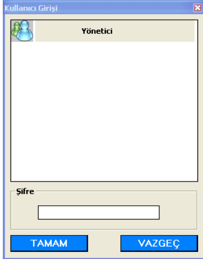
Şekil - 1 : Kullanıcı Girişi

Programa Giriş Ara Yüzünde Kullanıcı Adı Ve Şifresi İstenmektedir.( Şekil - 1 ) Her Kullanıcıya Farklı Yetkiler Verilebilir Ve Bu Yetkilerle Programda Dolaşılması Sağlanır. ( Şekil - 2 )